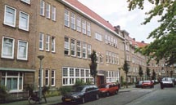
Nieuwe huisvesting van De Trap

Het mooiste zou zijn als je het hele traject van elementair naar masterclasses op het gebied van podium-, TV- en film-acteren kunt organiseren.”